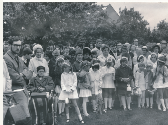
Fronleichnam in den 60er Jahren