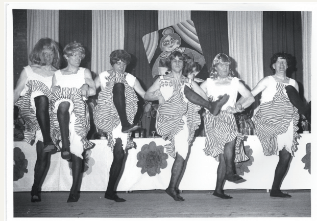
TaborDancer in den 70er Jahren